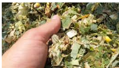
Voeder- & Kuiladditieven

Op deze demonstratiebeurzen werden veehouders objectief geïnformeerd over de gevaren en tijdige detectie van hittestress, alsook de vele mogelijkheden die er bestaan om hittestress te voorkomen of te bestrijden. Verschillende firma's demonstreerden er hun producten en diensten die ze rond dit thema aanbieden.