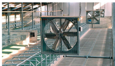
Ventilatoren / Verneveling Soaking