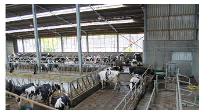
Stallenbouw & Stalinrichting