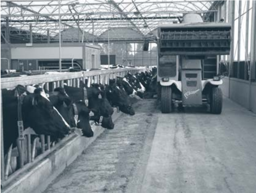
Stalvoeding. De opname van het voer hangt naast voerkenmerken onder meer af van de koefactoren: aantal dagen in lactatie, leeftijd en aantal dagen drachtig.

De invoer die nodig is voor het berekenen van de verzadigingswaarde, bestaat uit de gegevens die afkomstig zijn van de gangbare voederwaardeanalyse, zoals: